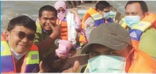
Survei Tim LPPM dan PSGA ke Desa Jaring Halus, Secanggang, Kabupaten Langkat dalam kegiatan Rangkaian Pengabdian Masyarakat