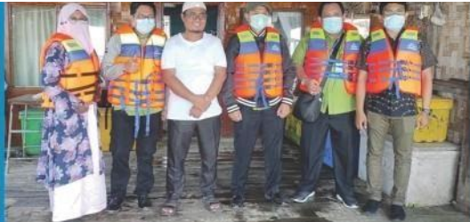
Survei Tim LPPM dan PSGA ke Desa Jaring Halus, Secanggang, Kabupaten Langkat dalam kegiatan Rangkaian Pengabdian Masyarakat